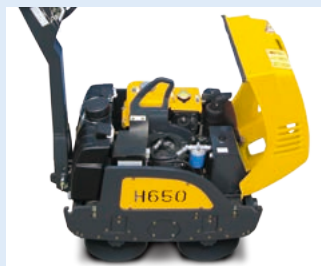
フルオープンの樹脂カバー