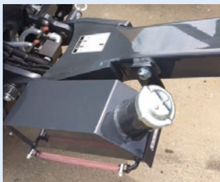
散油装置(オプション)