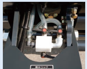
使い易い散水システム